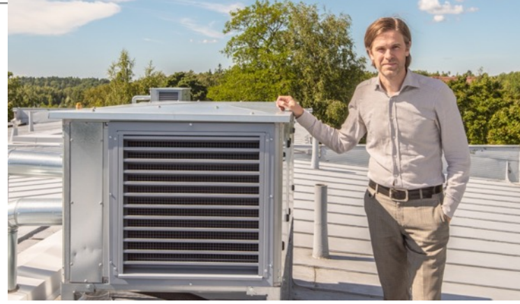
jo kertaalleen kerrostaloon hankittu ostoenergia kierrätetään poistoilmalämpöpumpulla takaisin tilojen ja käyttöveden lämmityskäyttöön