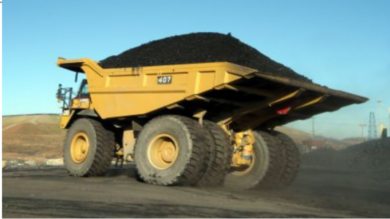
Dumpperillinen hiiltä voimalaitoksen vuosittain