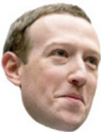
■ Zuckerberg. Mallikelpoinen.