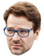
■ Niinistö. Tulevaisuudessa.

Tuo sopisi Soinin suuhun paremmin kuin lippalakki melonille. Kunhan vaihtaisi Facebookin persuiksi ja muuttaisi johtaa-verbin aikamuodon preesensistä imperfektiin. ■